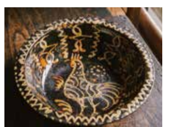
(スリブウェア陶文鉢)イギリス 18世紀後半 日本民藝館蔵

月曜休館(ただし5月5日は開館)、5月7日(水) https://www.chiba-muse.or.jp/ART/