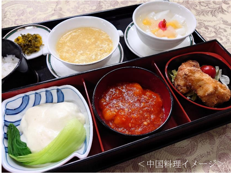
<中国料理イメージ>