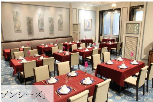
レストラン「セブンシーズ」