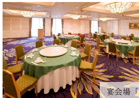
宴会場「ウィングルーム」