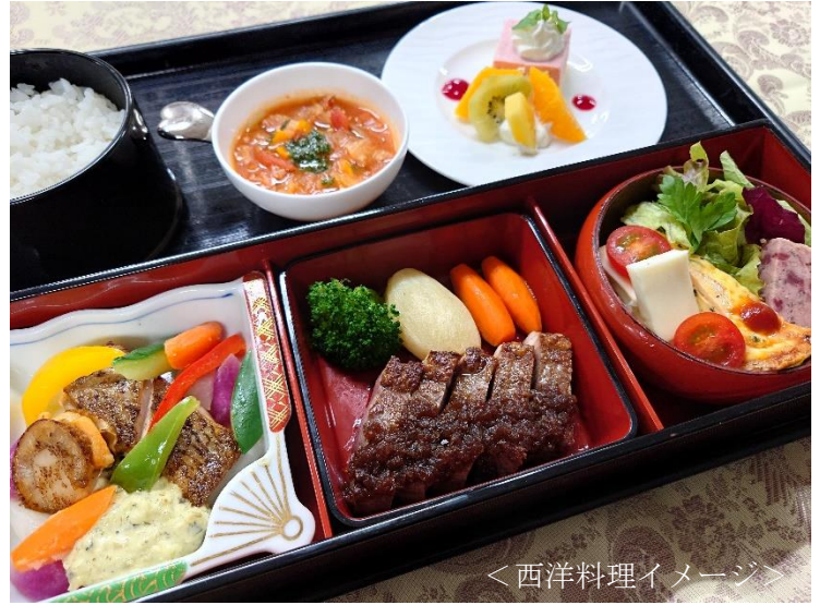
<西洋料理イメージ>