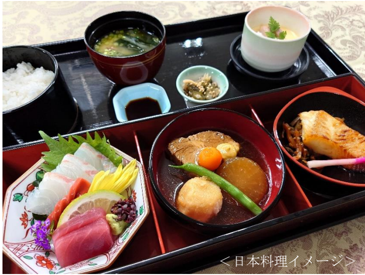
<日本料理イメージ>