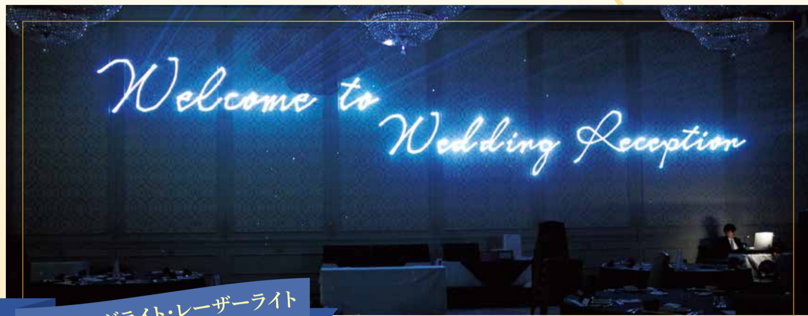
ムービングライト・レーザーライト

物語の舞台はおふたりのご披露宴会場。食器たちが歌い、踊り、ゲストの皆様との楽しいお食事を連想させるシーンや、壁の凹凸を活かした迫力のある3D映像が印象的な、おふたりの為にデザインされた唯一無二のプロジェクションマッピングが体感できます！