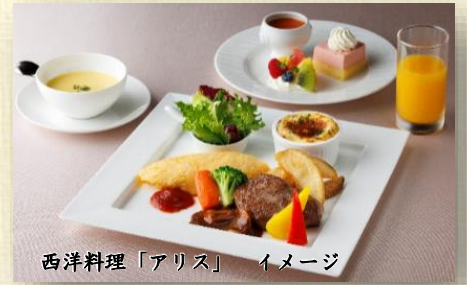
西洋料理「アリス」 イメージ