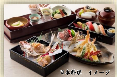
日本料理 イメージ