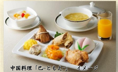
中国料理「巴-ともえ-」 イメージ