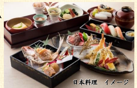
日本料理 イメージ