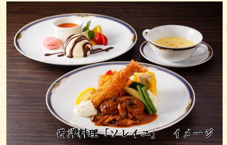
西洋料理「ソレイユ」 イメージ