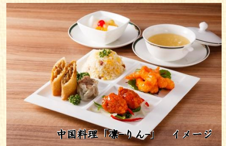
中国料理「凜-りん-」 イメージ